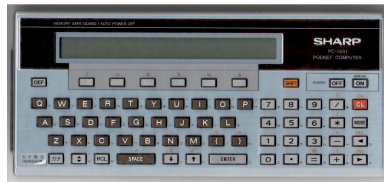
La calculatrice “PC-1501” de Sharp