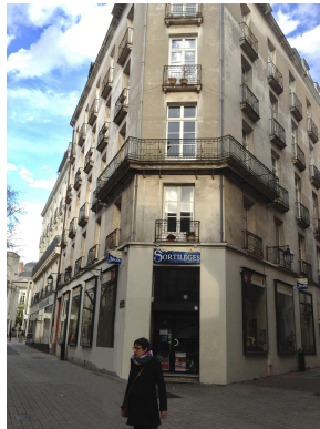
L'immeuble du 1 rue des 3 Croissants. à Nantes.

Mais pourtant, sur annonce, nous avons trouvé Celui qui tout de suite avait su nous combler : En plein centre, dans une rue semi-piétonne ;